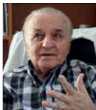
Acad. Constantin Ionescu-Tîrgoviște